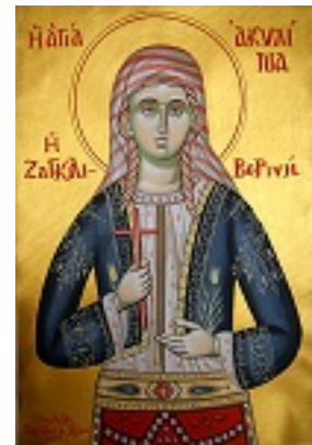
Αγία Ακυλίνα - Δια χειρός Νικ. Ζέκιου - zekiosicons.gr