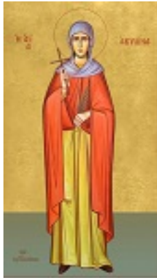
Αγία Ακυλίνα - Δια χειρός Νικ. Γαλανόπουλου - www.karadokis.gr