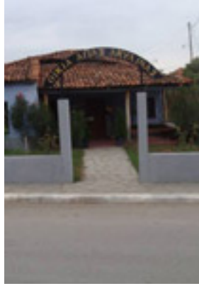
Οικία Αγίας Ακυλίνας