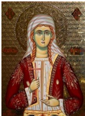
Αγία Ακυλίνα - Δια χειρός Νικ. Ζέκιου - zekiosicons.gr