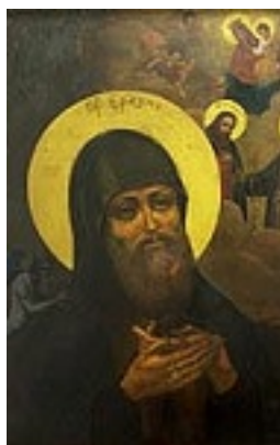
Όσιος Έρασμος εκ Ρωσίας