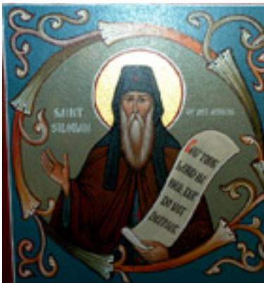
Άγιος Σιλουανός ο Αγιορείτης