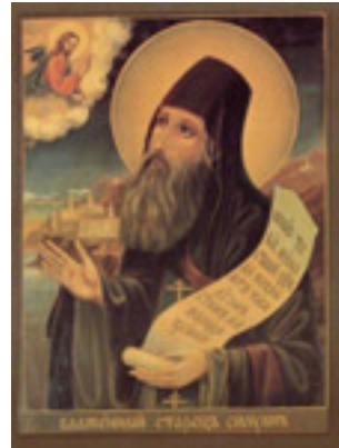
Άγιος Σιλουανός ο Αγιορείτης