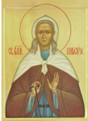
Οσία Παρασκευή του Σάρωφ - Ντιβέεβο