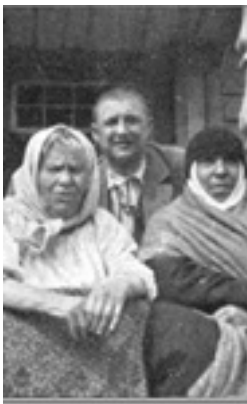
Οσία Παρασκευή του Σάρωφ - Ντιβέεβο