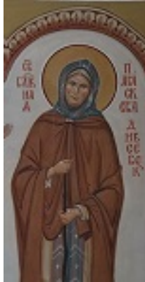
Οσία Παρασκευή του Σάρωφ - Ντιβέεβο