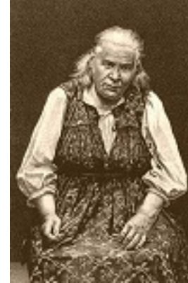
Οσία Παρασκευή του Σάρωφ - Ντιβέεβο