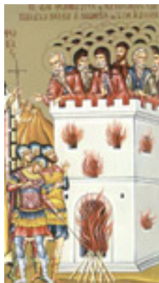
Άγιοι Είκοσι Έξι Οσιομάρτυρες Ζωγραφίτες