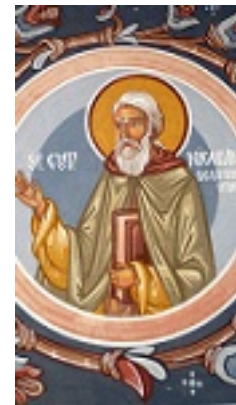
Όσιος Νικόδημος της Τισμάνα