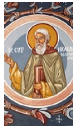
Όσιος Νικόδημος της Τισμάνα