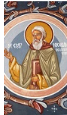
Όσιος Νικόδημος της Τισμάνα