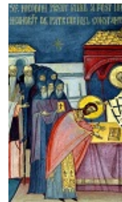
Η Χειροτονία του Οσίου Νικοδήμου της Τισμάνα