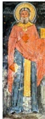
Όσιος Νικόδημος της Τισμάνα