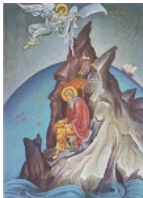
Όσιος Ρωμύλος της Ραβάνιτσας