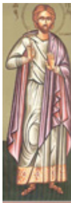
Άγιος Αγγελής ο Νεομάρτυρας γιατρός από το Άργος