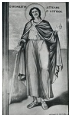
Άγιος Αγγελής ο Νεομάρτυρας γιατρός από το Άργος