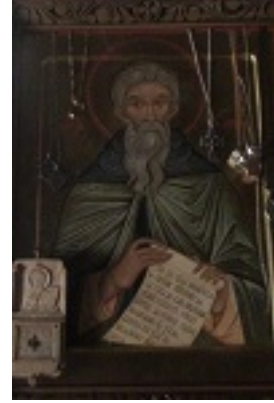
Όσιος Χαρίτων ο Ομολογητής