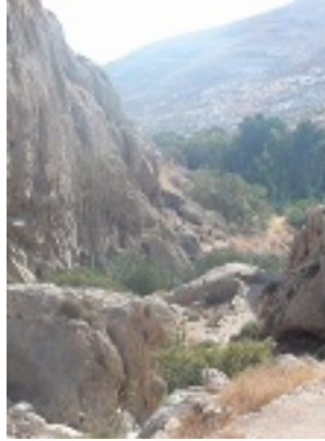
Ο τόπος ασκήσεως του Οσίου Χαρίτωνος