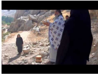
Υπαίθρια θ. Λειτουργία στον Άγιο Χαρίτωνα