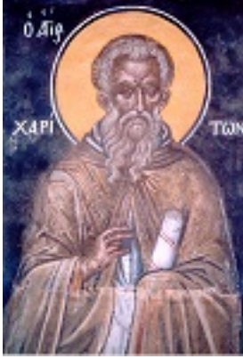
Όσιος Χαρίτων ο Ομολογητής - Θεοφάνους του Κρητός Καθολικόν Μ. Λαύρας