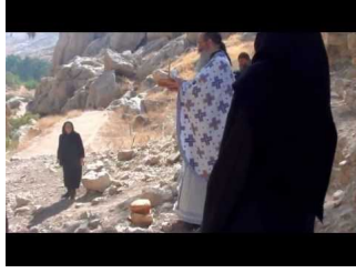
Υπαίθρια θ. Λειτουργία στον Άγιο Χαρίτωνα