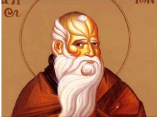
Ακούστε το απολυτίκιο!