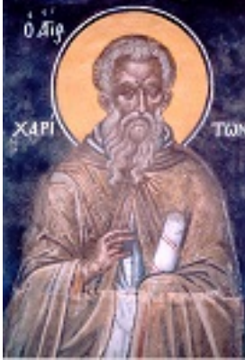
Όσιος Χαρίτων ο Ομολογητής - Θεοφάνους του Κρητός Καθολικόν Μ. Λαύρας