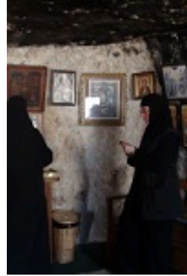
Στο σπήλαιο του Οσίου Χαρίτωνος