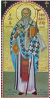
Άγιος Ηρακλείδης επίσκοπος Ταμάσου Κύπρου