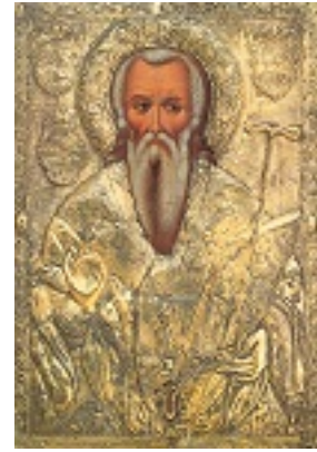
Άγιος Ηρακλείδης επίσκοπος Ταμάσου Κύπρου