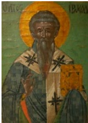
Άγιος Ηρακλείδης επίσκοπος Ταμάσου Κύπρου - 18ος αιώνας μ.Χ