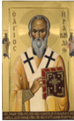
Άγιος Ηρακλείδης επίσκοπος Ταμάσου Κύπρου - Εικόνα από το Αγιογραφείο της Μονής Βατοπαιδίου