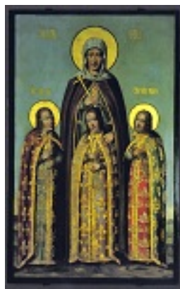
Αγία Σοφία και οι τρεις θυγατέρες της Πίστη, Ελπίδα και Αγάπη