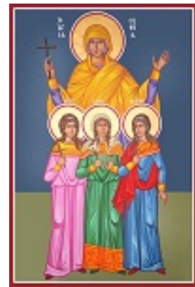
Αγία Σοφία και οι τρεις θυγατέρες της Πίστη, Ελπίδα και Αγάπη - Καζακίδου Μαρία© (byzantineartkazakidou. blogspot.com)