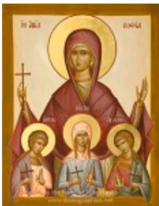
Αγία Σοφία και οι τρεις θυγατέρες της Πίστη, Ελπίδα και Αγάπη - Julia Hayes© (www.ikonographics.net)