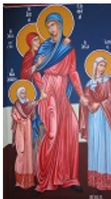
Αγία Σοφία και οι τρεις θυγατέρες της Πίστη, Ελπίδα και Αγάπη - Πηνελόπη Σχιζοδήμου© (www.porpe.gr)