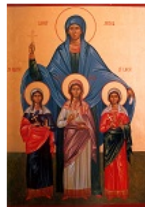
Αγία Σοφία και οι τρεις θυγατέρες της Πίστη, Ελπίδα και Αγάπη