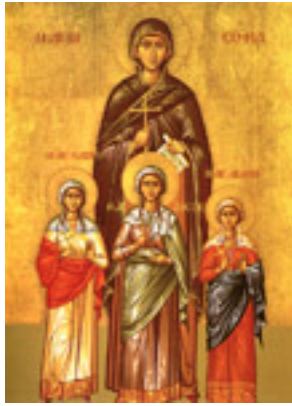
Αγία Σοφία και οι τρεις θυγατέρες της Πίστη, Ελπίδα και Αγάπη