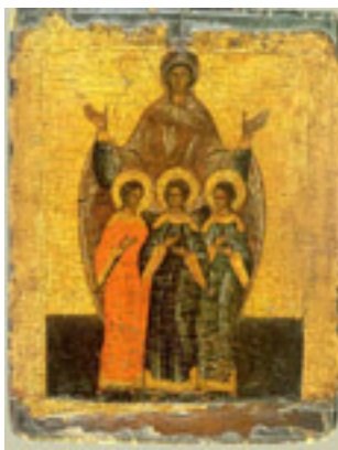
Αγία Σοφία και οι τρεις θυγατέρες της Πίστη, Ελπίδα και Αγάπη