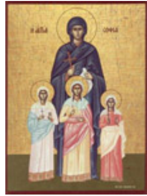
Αγία Σοφία και οι τρεις θυγατέρες της Πίστη, Ελπίδα και Αγάπη