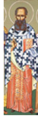
Άγιος Βησσαρίων Αρχιεπίσκοπος Λαρίσης