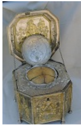
Η αγία κάρα του Αγίου Βησσαρίωνα Αρχιεπισκόπου Λαρίσης