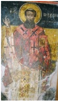
Άγιος Βησσαρίων Αρχιεπίσκοπος Λαρίσης