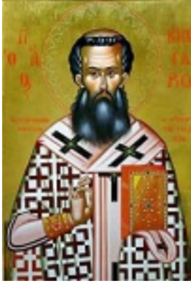
Άγιος Βησσαρίων Αρχιεπίσκοπος Λαρίσης