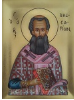
Άγιος Βησσαρίων Αρχιεπίσκοπος Λαρίσης - Λυδία Γουριώτη© ( http://lydiagourioti- iconography.blogspot.com )