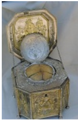
Η αγία κάρα του Αγίου Βησσαρίωνα Αρχιεπισκόπου Λαρίσης