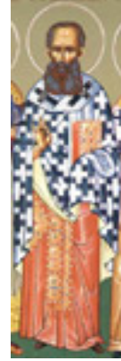
Άγιος Βησσαρίων Αρχιεπίσκοπος Λαρίσης