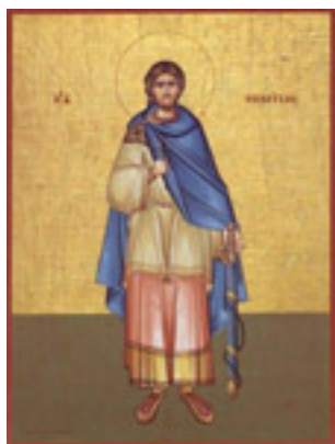
Άγιος Νικήτας ο Γότθος ο μεγαλομάρτυρας