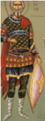
Άγιος Κορνήλιος ο Εκατόνταρχος