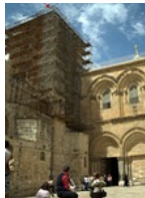
Ιερός Ναός της Αναστάσεως