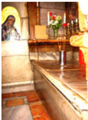
Ιερός Ναός της Αναστάσεως