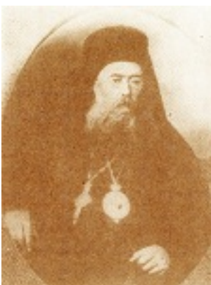
Άγιος Γρηγόριος Κυδωνίων