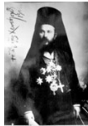
Άγιος Χρυσόστομος Σμύρνης - 1910 μ.Χ.