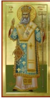
Άγιος Χρυσόστομος Σμύρνης