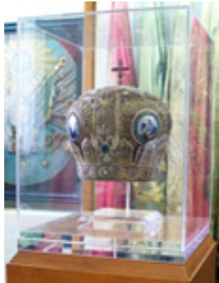
Η μίτρα του Χρυσόστομου Σμύρνης. Εθνικό Ιστορικό Μουσείο, Αθήνα