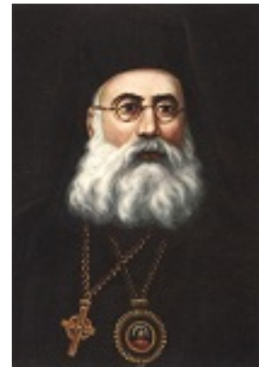
Άγιος Γρηγόριος Κυδωνίων