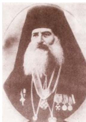
Άγιος Αμβρόσιος Μοσχονησίων