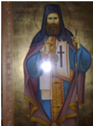
Άγιος Προκόπιος Ικονίου (έργο Αναστασίου Δρακόπουλου - Ιερός Ναός Αγίου Κοσμά Αιτωλού Ν.Φιλαδέλφειας)