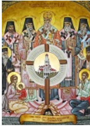
Άγιος Χρυσόστομος Σμύρνης και οι συν αυτώ Άγιοι Αρχιερείς Γρηγόριος Κυδωνίων, Αμβρόσιος Μοσχονησίων, Προκόπιος Ικονίου, Ευθύμιος Ζήλων καθώς και οι κληρικοί και λαϊκοί που σφαγιάσθηκαν κατά την Μικρασιατική Καταστροφή