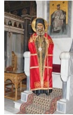
Εικόνα του Αγίου Χρυσοστόμου Σμύρνης σε φυσική κλίμακα απο τον Ι. Ν. Παναγίας Παντοβασίλισσας Νέας Τριγλίας Χαλκιδικής που φέρει το αυθεντικό επιτραχήλιο του Αγίου