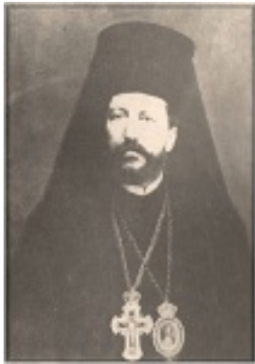
Άγιος Ευθύμιος ο Ιερομάρτυρας Επίσκοπος Ζήλων