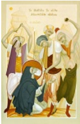
Άγιος Χρυσόστομος Σμύρνης - Δια χειρός Φίκου