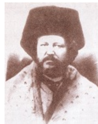
Άγιος Ευθύμιος ο Ιερομάρτυρας Επίσκοπος Ζήλων