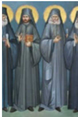
Άγιοι Αρχιερείς Προκόπιος Ικονίου, Γρηγόριος Κυδωνίων, Αμβρόσιος Μοσχονησίων, Ευθύμιος Ζήλων