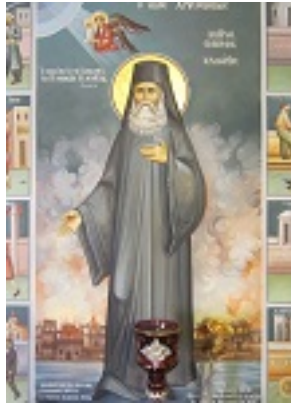
Άγιος Χρυσόστομος Σμύρνης