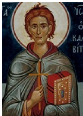
Όσιος Ιωάννης ο Καλυβίτης