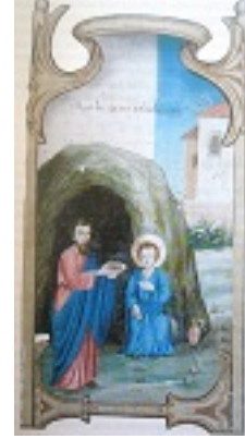
Όσιος Ιωάννης ο Καλυβίτης