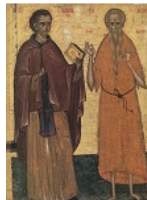
Όσιος Ιωάννης ο Καλυβίτης και Όσιος Παύλος ο Θηβαίος