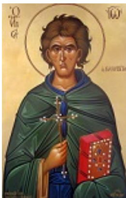
Όσιος Ιωάννης ο Καλυβίτης - Μιχαήλ Χατζημιχαήλ© www.michaelhadjimichael.com