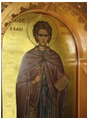
Όσιος Ιωάννης ο Καλυβίτης