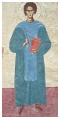
Όσιος Ιωάννης ο Καλυβίτης - Εικόνα από τον Προαύλιο Χώρο της Ιεράς Μονής Αγίου Ιωάννη Καλυβίτη στα Ψαχνά Ευβοίας