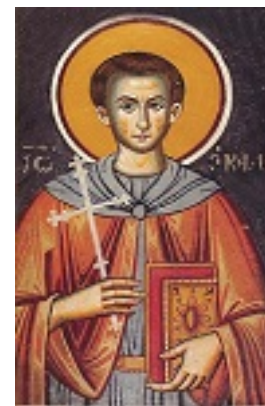
Όσιος Ιωάννης ο Καλυβίτης