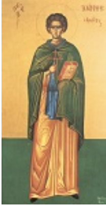
Όσιος Ιωάννης ο Καλυβίτης