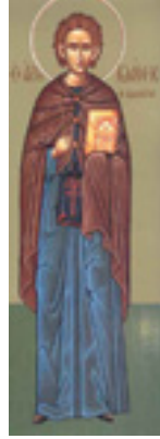
Όσιος Ιωάννης ο Καλυβίτης