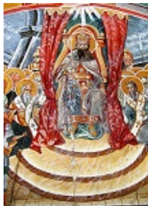
ΣΤ' Οικουμενική Σύνοδος