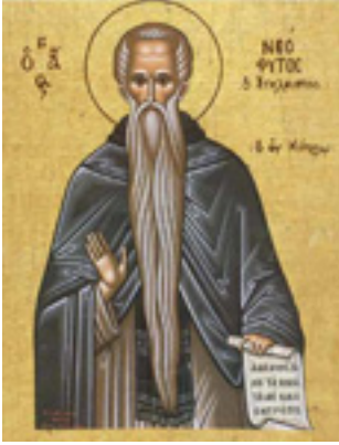
Ἵσιος Νεόφυτος ὁ ἐγκλειστος που ασκήτευσε στην Κύπρο