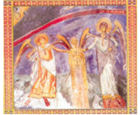
Ἵσιος Νεόφυτος ὁ ἐγκλειστος που ασκήτευσε στην Κύπρο