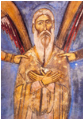
Ἵσιος Νεόφυτος ὁ ἐγκλειστος που ασκήτευσε στην Κύπρο. Τοιχογραφία του 1193 μ.Χ. (λεπτομέρεια παραστάσεως)