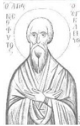
Ἵσιος Νεόφυτος ὁ ἐγκλειστος που ασκήτευσε στην Κύπρο