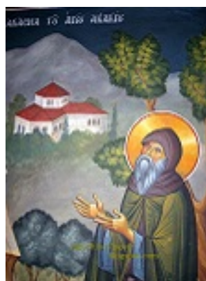
Όσιος Ακάκιος ο Νέος, ο Καυσοκαλυβίτης - Τοιχογραφία Ι. Ν. Ευαγγελιστρίας Περισού