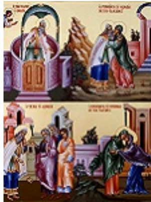
Προφήτης Ζαχαρίας και η σύζυγος του Ελισάβετ