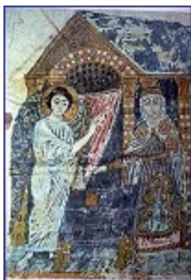
Ο ευαγγελισμός του Ζαχαρία - Μικρογραφία από αρχαίο αρμενικό χειρόγραφο