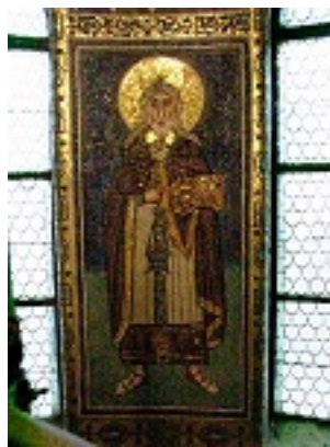
Προφήτης Ζαχαρίας - Ψηφιδωτό του 6ου αιώνα μ.Χ. στην βυζαντική βασιλική του Ευφράσιου στο Porec της Κροατίας