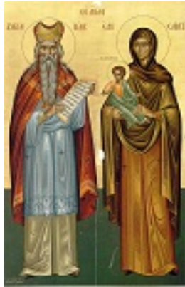
Προφήτης Ζαχαρίας και η σύζυγος του Ελισάβετ