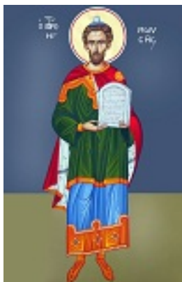
Προφήτης Μωυσής ο Θεόπτης - Καζακίδου Μαρία© (byzantineartkazakidou. blogspot.com)