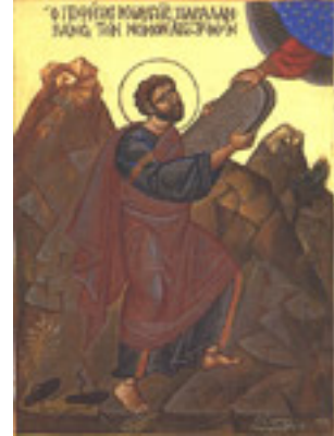
Προφήτης Μωυσής ο Θεόπτης