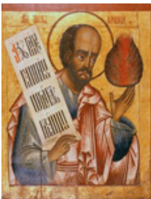
Προφήτης Μωυσής ο Θεόπτης