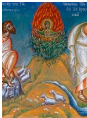
Προφήτης Μωυσής ο Θεόπτης - π. Σταμάτης Σκλήρης© (stamatis- skliris.gr)