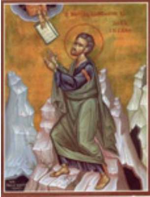
Προφήτης Μωυσής ο Θεόπτης