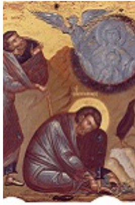
Προφήτης Μωσής ο Θεόπτης