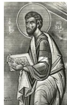
Προφήτης Μωυσής ο Θεόπτης - Φώτης Κόντογλου