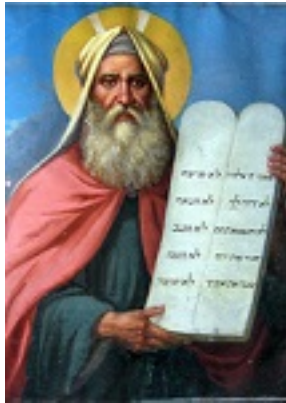
Προφήτης Μωσής ο Θεόπτης - Ανάστασις Σύρου