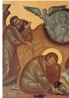
Προφήτης Μωσής ο Θεόπτης