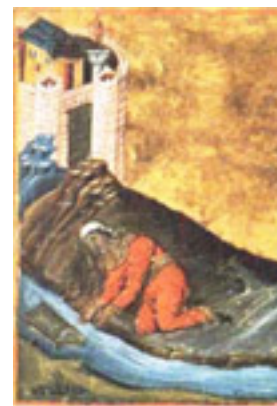
Προφήτης Μωυσής ο Θεόπτης