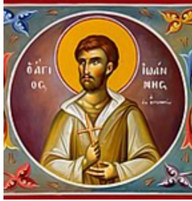
Άγιος Ιωάννης ο Νεομάρτυρας ο εξ Αγαρηνών