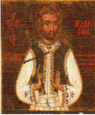
Άγιος Ιωάννης ο Νεομάρτυρας ο εξ Αγαρηνών