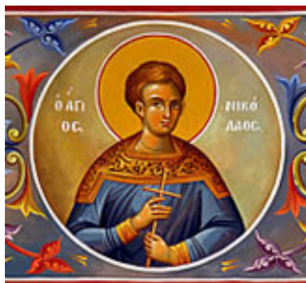
Άγιος Νικόλαος ο παντοπώλης