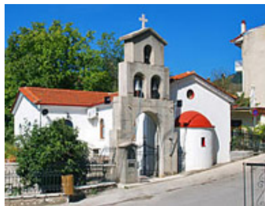
Ναός του Αγίου Νικολάου του παντοπώλη