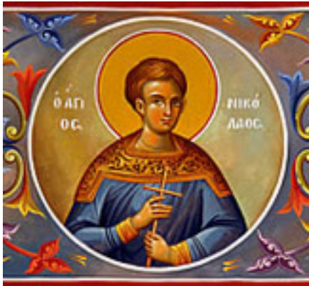
Άγιος Νικόλαος ο παντοπώλης