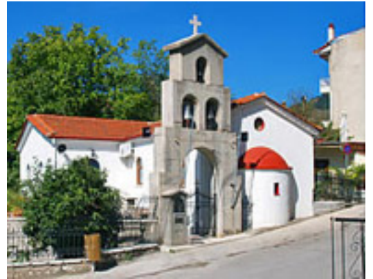
Ναός του Αγίου Νικολάου του παντοπώλη