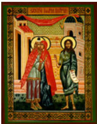
Άγιος Ιωάννης Πρόδρομος και Βαπτιστής (Σύλληψη)