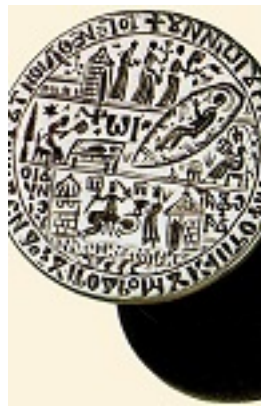
Σφραγίδα Μονής Διονυσίου με τις παράστασεις της Γεννήσεως του Προδρόμου και της Αποτομής της κεφαλής του Προδρόμου - 1636 μ.Χ. - Μονή Διονυσίου, Άγιον Όρος