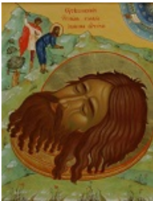
Η Αποτομή της Τιμίας Κεφαλής του Αγίου Ιωάννου του Προδρόμου