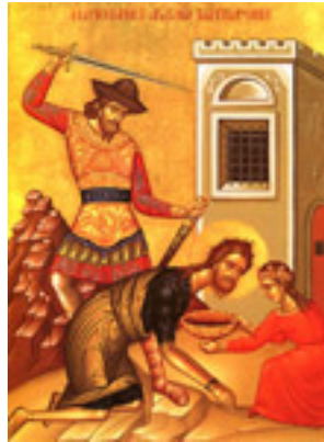
Η Αποτομή της Τιμίας Κεφαλής του Αγίου Ιωάννου του Προδρόμου