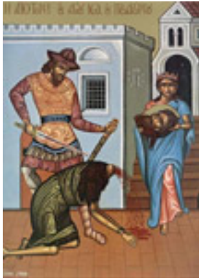
Η Αποτομή της Τιμίας Κεφαλής του Αγίου Ιωάννου του Προδρόμου