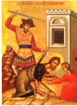
Η Αποτομή της Τιμίας Κεφαλής του Αγίου Ιωάννου του Προδρόμου