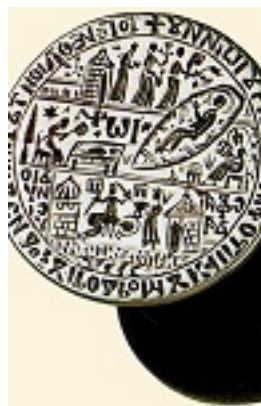
Σφραγίδα Μονής Διονυσίου με τις παράστασεις της Γεννήσεως του Προδρόμου και της Αποτομής της κεφαλής του Προδρόμου - 1636 μ.Χ. - Μονή Διονυσίου, Άγιον Όρος