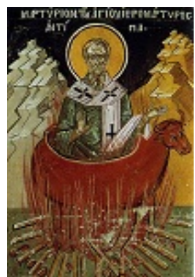
Το μαρτύριο του Αγίου Αντίπα