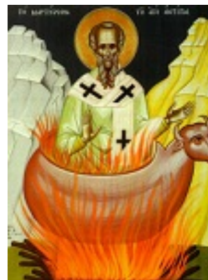
Άγιος Αντίπας Επίσκοπος Περγάμου Άγιος Αντίπας Επίσκοπος Περγάμου Το μαρτύριον του Αγίου Αντίπα, προστάτου των Ελλήνων οδοντιάτρων. Φορητή εικόνα δια χειρός Ιερομονάχου Ρωμανού Φωκάκη από τη Συλλογή του Ιερού Κελλίου Αγίας Άννης Καρυών Αγίου Όρους.