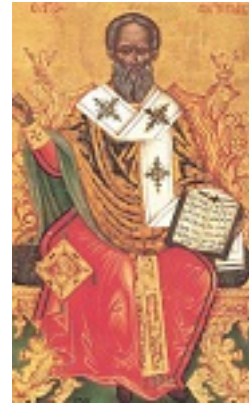
Άγιος Αντίπας Επίσκοπος Περγάμου Άγιος Αντίπας Επίσκοπος Περγάμου Άγιος Αντίπας Επίσκοπος Περγάμου