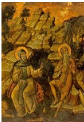
Άγιος Αντώνιος και Άγιος Παύλος ο Θηβαίος - β'μισό του 17ου αι. μ.Χ. - Μονή Ξηροποτάμου, Άγιον Όρος