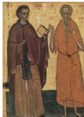
Όσιος Ιωάννης ο Καλυβίτης και Όσιος Παύλος ο Θηβαίος