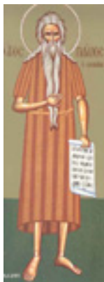
Όσιος Παύλος ο Θηβαίος