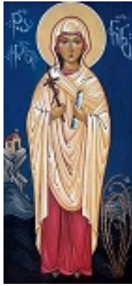
Αγία Νίνα Ισαπόστολος