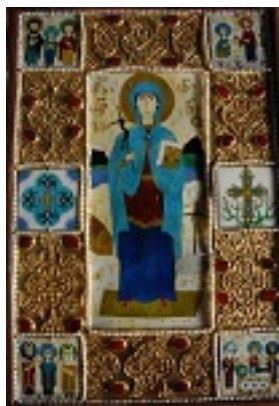
Παραδοσιακή γεωργιανική εικόνα της αγίας Νίνας από σμάλτο και πολύτιμους λίθους