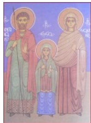
Οι Άγιοι Ζαβουλών και Σωσάνη μαζί με την Αγία Νίνα