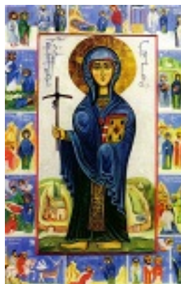
Αγία Νίνα Ισαπόστολος