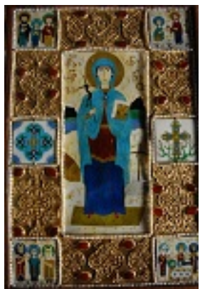
Παραδοσιακή γεωργιανική εικόνα της αγίας Νίνας από σμάλτο και πολύτιμους λίθους