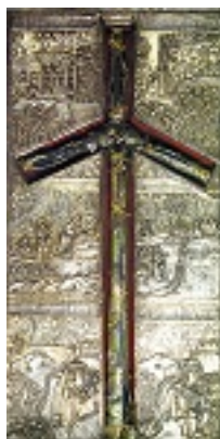
Ο Σταυρός της Αγίας Νίνα