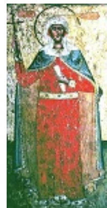
Αγία Νίνα Ισαπόστολος