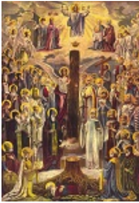
Αγία Νίνα Ισαπόστολος