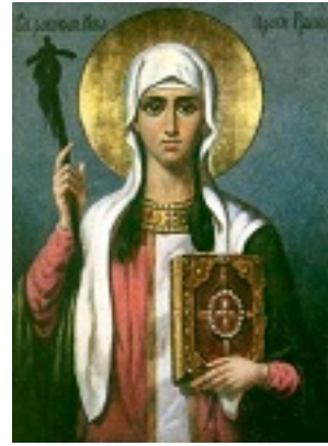
Αγία Νίνα Ισαπόστολος