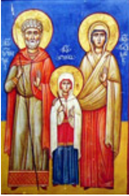
Οι Άγιοι Ζαβουλών και Σωσσάνη μαζί με την Αγία Νίνα