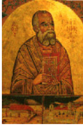
Όσιος Ευγένιος ο Αιτωλός