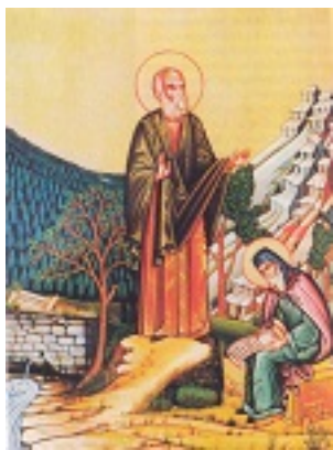
Ο Άγιος Ευγένιος με τον μαθητή του Αναστάσιο