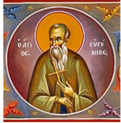
Όσιος Ευγένιος ο Αιτωλός