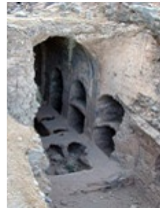
Το σπήλαιο των Επτά Παιδων στην Έφεσο