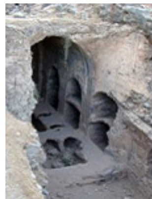
Το σπήλαιο των Επτά Παίδων στην Έφεσο