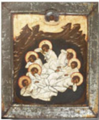
Άγιοι Επτά Παιδες εν Εφέσω