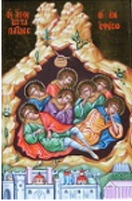
Άγιοι Επτά Παιδες εν Εφέσω