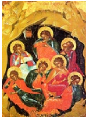
Άγιοι Επτά Παιδες εν Εφέσω