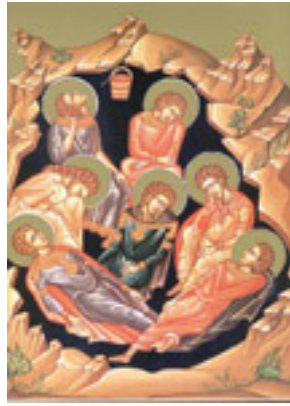
Άγιοι Επτά Παιδες εν Εφέσω