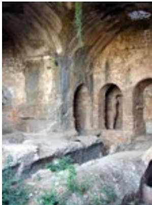
Το σπήλαιο των Επτά Παιδων στην Έφεσο