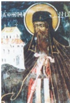
Όσιος Θεοφάνης ο νέος και θαυματουργός - Τοιχογραφία Ι. Μ. Δοχειαρίου (1744 μ.Χ.)