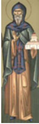
Όσιος Θεοφάνης ο νέος και θαυματουργός