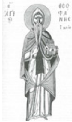
Όσιος Θεοφάνης ο νέος και θαυματουργός