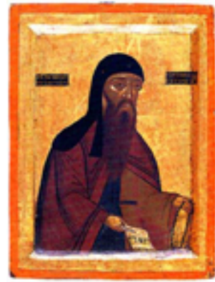
Όσιος Θεοφάνης ο νέος και θαυματουργός