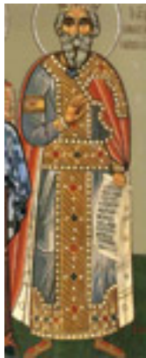
Δίκαιος Εζεκίας ο Βασιλιάς