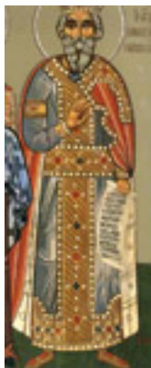
Δίκαιος Εζεκίας ο Βασιλιάς