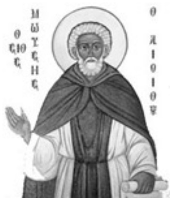
Όσιος Μωυσής ο Αιθίοπας