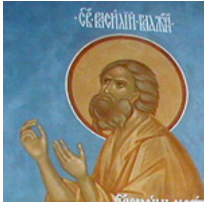
Άγιος Βασίλειος ο δια Χριστόν σαλός και θαυματουργός