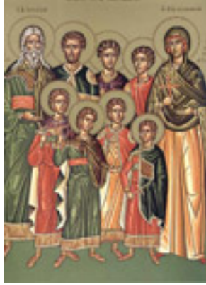
Άγιοι Επτά Μακκαβαίοι, η μητέρα τους Σολομονή και ο διδάσκαλός τους Ελεάζαρος