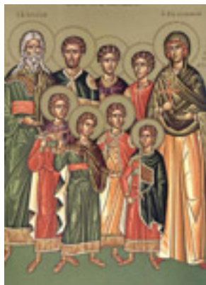
Άγιοι Επτά Μακκαβαίοι, η μητέρα τους Σολομονή και ο διδάσκαλός τους Ελεάζαρος