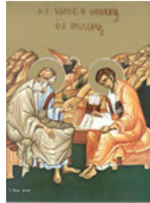
Άγιος Πρόχορος και Άγιος Ιωάννης ο Θεολόγος