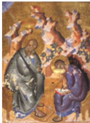
Άγιος Πρόχορος και Άγιος Ιωάννης ο Θεολόγος