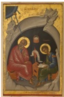
Άγιος Πρόχορος και Άγιος Ιωάννης ο Θεολόγος - Εμμανουήλ Λαμπάρδος, 1602 μ.Χ.