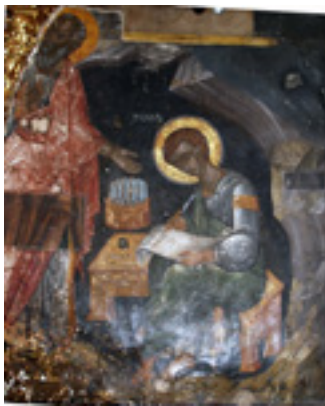
Άγιος Πρόχορος και Άγιος Ιωάννης ο Θεολόγος