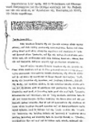
Επίσημος κατάταξη του Αγ. Ραφαήλ και των συν αυτώ, εις το Αγιολόγιον της Εκκλησίας