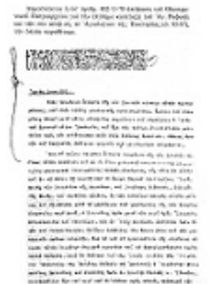
Επίσημος κατάταξη του Αγ. Ραφαήλ και των συν αυτώ, εις το Αγιολόγιον της Εκκλησίας