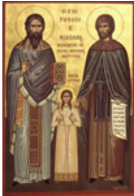
Άγιοι Ραφαήλ, Νικόλαος, Ειρήνη και οι συν αυτοίς