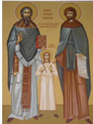
οι συν αυτοίς