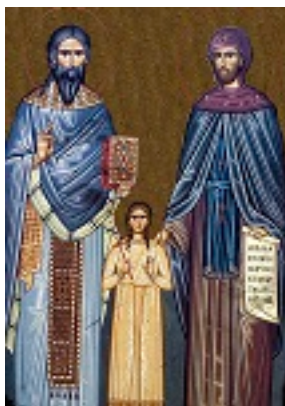
Άγιοι Ραφαήλ, Νικόλαος, Ειρήνη και οι συν αυτοίς