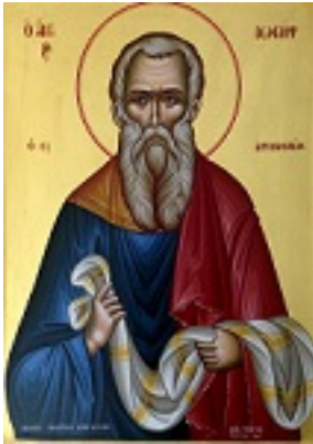
Άγιος Ιωσήφ ο από Αριμαθαίας