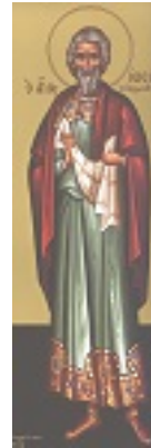
Άγιος Ιωσήφ ο από Αριμαθαίας