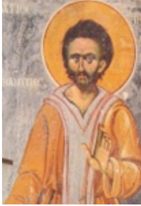
Άγιος Νικόδημος από το Ελβασάν ο Νέος οσιομάρτυρας