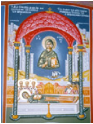
Το θαύμα της Αγίας Ευφημίας