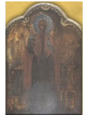
Αγία Ευφημία, ΑΨΜΑ' (1741 μ.Χ.) Ίουλίου 13, διὰ χειρὸς τοῦ Ἱεροθέου ἱερομονάχου τοῦ Πατριαρχείου