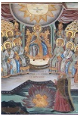
Ε' Οικουμενική Σύνοδος - Άγιον Όρος, Μεγίστη Λαύρα