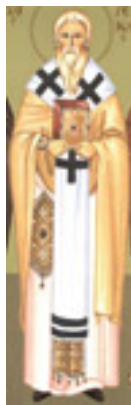
Άγιος Αθηνογένης επίσκοπος Πηδαχθός