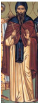
Όσιος Στέφανος ο Σαββαΐτης