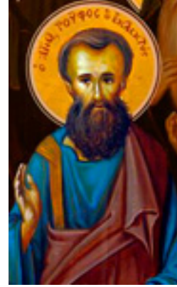
Άγιος Ρούφος ο Απόστολος από τους Ο'