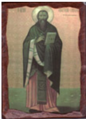
Άγιος Αναστάσιος, ο εξ Αγίου Βλασίου, ο Γουναράς