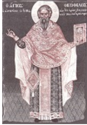
Όσιος Θεόφιλος ο Αγιορείτης