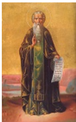
Όσιος Θεόφιλος ο Αγιορείτης