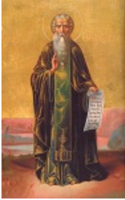
Όσιος Θεόφιλος ο Αγιορείτης