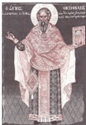
Όσιος Θεόφιλος ο Αγιορείτης