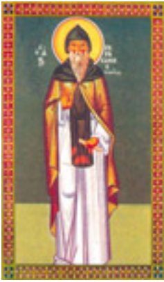
Όσιος Γεράσιμος<br />ο Βυζάντιος Όσιος Γεράσιμος<br />ο Βυζάντιος