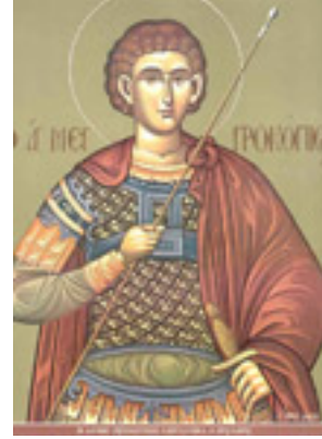
Άγιος Προκόπιος ο Μεγαλομάρτυς Άγιος Προκόπιος ο Μεγαλομάρτυς - Άγιος Προκόπιος ο Μεγαλομάρτυς Μιχαήλ Χατζημιχαήλ© www.michaelhadjimichael.com