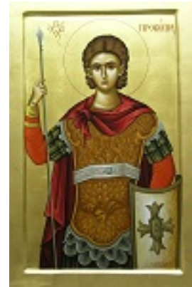
Άγιος Προκόπιος ο Μεγαλομάρτυς Άγιος Προκόπιος ο Μεγαλομάρτυς Άγιος Προκόπιος ο Μεγαλομάρτυς