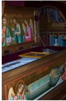
Όσιος Σάββας ο Νέος ο εν Καλύμνω Όσιος Σάββας ο Νέος ο εν Καλύμνω